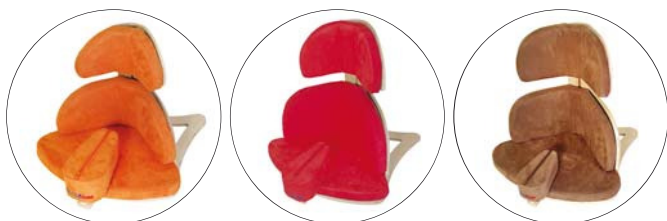
Nook misura 3